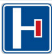
IP10b Návěst před slepou pozemní komunikací