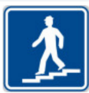
IP3 Podchod nebo nadchod