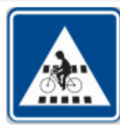
IP7 Přejezd pro cyklisty