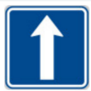
IP4b Jednosměrný provoz