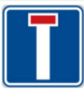
IP10a Slepá pozemní komunikace