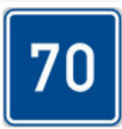
IP5 Doporučená rychlost