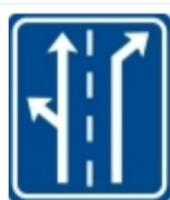
IP19 Řadičí pruhy