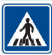
IP6 Přečhod pro chodce