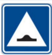
IP2 Zpomalovací práh