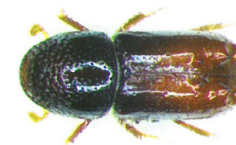
Dospělec lýkožrouta lesklého

Lýkožrout lesklý (cca 2 mm) se vyvíjí pod kůrou větví starých smrků, ve vrcholové části koruny nebo na mladých stromcích; na kmenech dospělých smrků ve střední a spodní části se vyskytuje méně často. Vývoj trvá 6 – 10 týdnů.