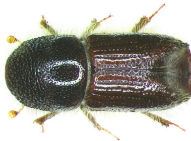
Dospělec lýkožrouta smrkového

Lýkožrout smrkový (cca 5 mm) napadá především čerstvě odumřelé dříví (polomy, vytěžené dříví v porostu nebo na skládkách), dále pak oslabené stojící stromy (např. suchem) a při přemnožení i zdravé stojící stromy. Vývoj probíhá pod kůrou na kmenech