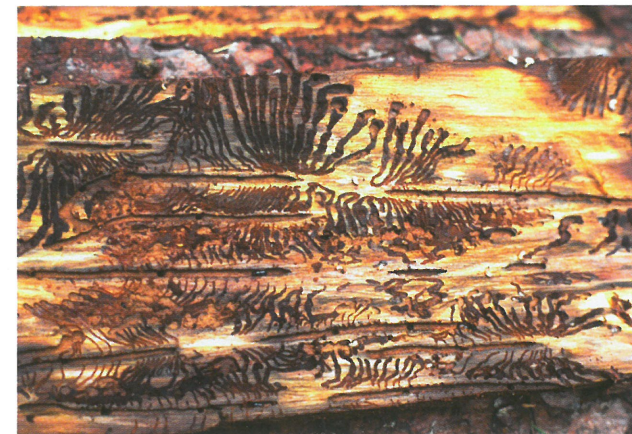
Rozvinutý požerek lýkožrouta smrkového

dospělých smrků s výjimkou jejich vrcholku (nejčastěji od stáří 60 let, výjimečně i mladších). Jeho vývoj trvá obvykle 6 – 10 týdnů, v závislosti na teplotě.