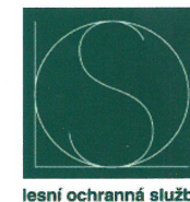
lesní ochranná služba

V prvé řadě je možné se obrátit na svého odborného lesního hospodáře. Druhou možností je obrátit se na pracovníky Lesní ochranné služby – LOS ( www.vulhm.cz/los , tel.: 257 892 222), kteří Vám bezplatně poradí, co a jak provést, abyste splnili zákonnou povinnost a zabránili vzniku dalších škod kůrovci. Na stránkách LOS najdete i další informace o kůrovcích.