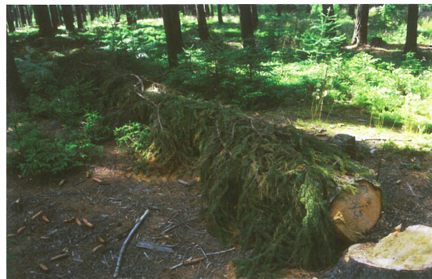
Lapák zakrytý větvemi

Lapák je pokácený a odvětvený strom, podložený (aby brouci mohli využít celou plochu kmene) a zpravidla zakrytý větvemi (zpomalení vysychání kůry). Kácí se před předpokládaným začátkem rojení, tj. zpravidla do konce března. Lapáky se musí kontrolovat, a to především z důvodu jejich obsazení, aby bylo možné včas přikácet další lapáky. Ty se přikacují, je-li lapák plně obsazen (cca 1 závrt na 1 dm 2 v nejhustěji napadené části kmene). Současně se kontroluje vývoj lýkožroutů, aby bylo možné lapáky včas asanovat.