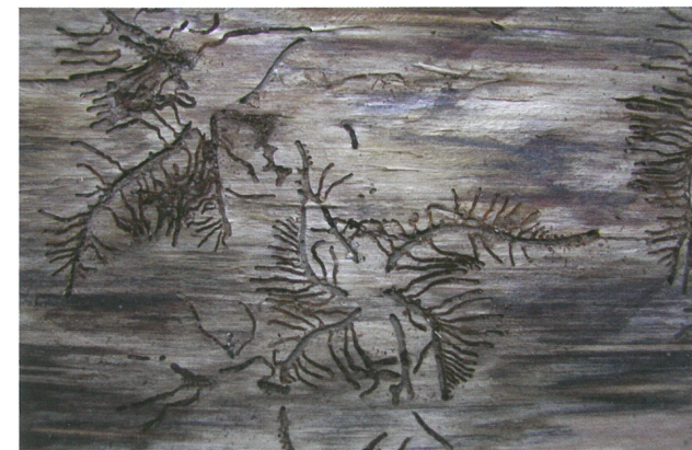
Požerek lýkožrouta lesklého