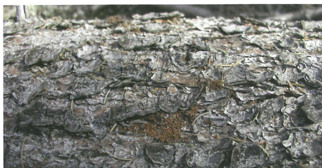
Drtinky na ležícím kmenu